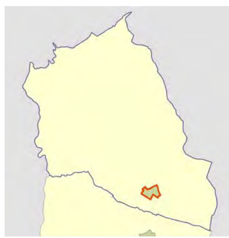
Localización del AEV dentro del término municipal