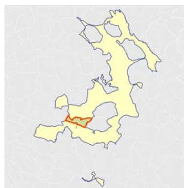
Localización del barrio vulnerable dentro del término municipal